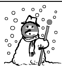
de la neige